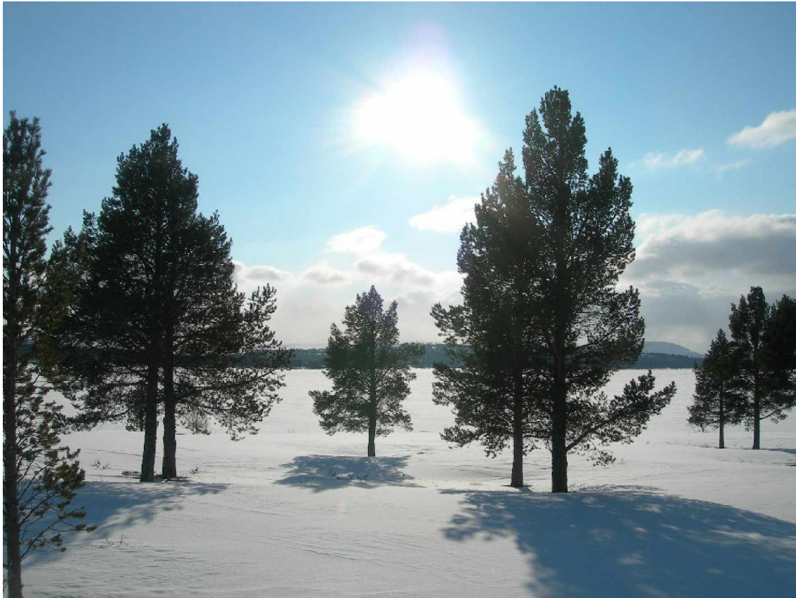
Foto gemaakt op de Kvamsfjellet (Nationaal Park Rondane) tijdens een langlauftocht.