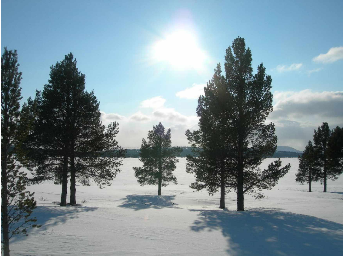
Foto gemaakt op de Kvamsfjellet (Nationaal Park Rondane) tijdens een langlauftocht.