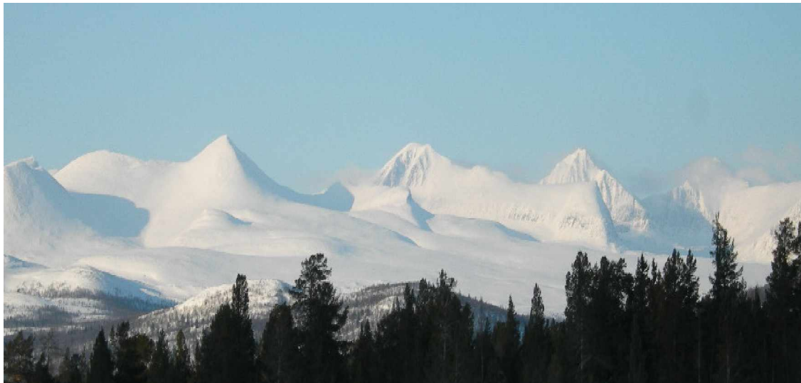
Foto gemaakt op de Kvamsfjellet (Rondane, einde maart 2006). Wellicht het mooiste langlaufgebied.

De provincie oppland, waar Gudbrandsdalen een deel van is wordt dit bijzondere natuurgebied geprezen met de titel: "Parel van Gudbrandsdalen".